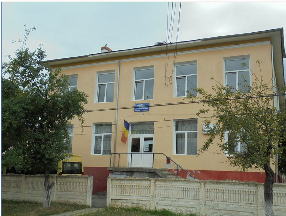
Fig. 6 Sursa foto: