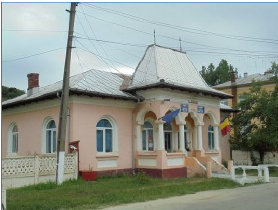
Fig. 9 Sursa foto: