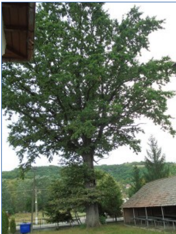
Fig. 4

Unitățile de vegetație din spațiul județului sunt dispuse în fâșii ce se succed de la S la N, fiind reprezentate de: