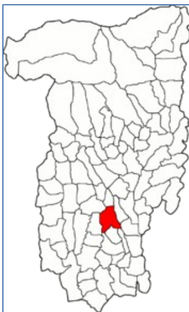
Fig. 3