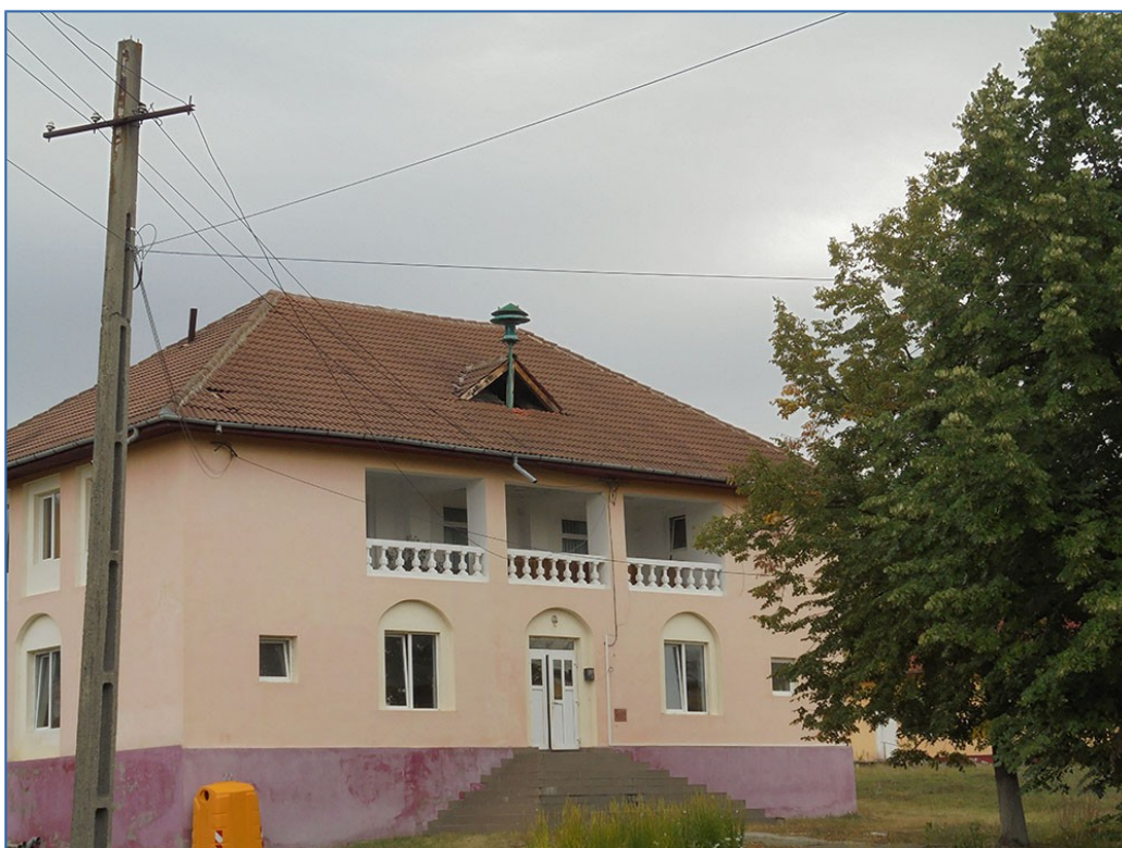
Fig. 7 Sursa foto:

Din punct de vedere al cultului religios, de la început se poate spune că majoritatea sătenilor (96,69%) din cele cinci sate ale comunei aparțin cultului religios ortodox. Pentru practicarea lui, în comuna sunt nouă biserici, din care în satul Olteanca 5, Jarostea 1, Aninoasa 1, Glăvile 1 și un schit.