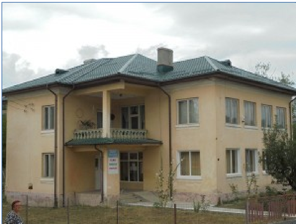
Fig. 8 Sursa foto:

Măsurile de reformă privesc, în principal restructurarea modului de organizare și furnizare a serviciilor destinate îngrijirii sănătății și schimbarea modului de finanțare a activității și sunt centrate pe introducerea asigurărilor sociale de sănătate.